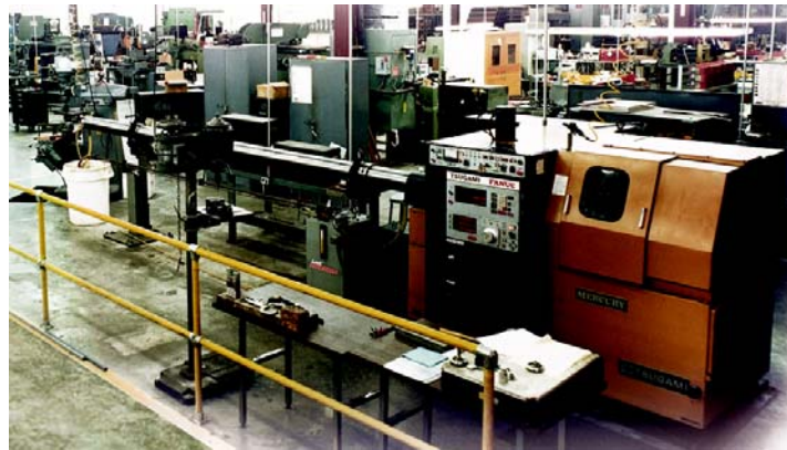
NOV 在 Sam Houston Parkway 的制造厂