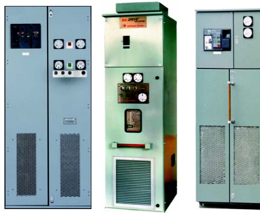
(由左到右) NOV 的 Ross Hill™, TPC™ 和 IPS™ 机柜